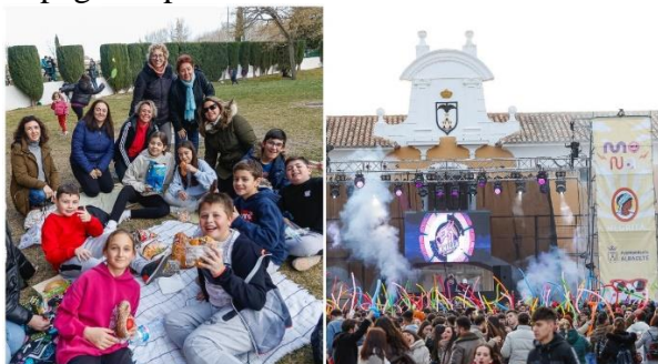
Merienda y fiesta de Jueves Lardero

El día 8 de febrero se celebró el día de Jueves Lardero. En algunos lugares de Albacete se celebraron espectáculos de música, atracciones en la Fiesta del Árbol. En el pincho y en los ejidos de la feria hubo DJ's, música en directo, actividades, juegos, talleres, así como actividades deportivas de baloncesto, volleyball y atletismo. Otros lugares donde también tuvieron lugar actividades fueron el Centro Joven con vídeogame y aula de naturaleza de La Pulgosa donde los jóvenes realizaron gincana y proyección de vídeos de naturaleza. Sobre todo, los que más disfrutaron fueron los más pequeños que como todos los años se comieron su mona rodeados de sus amigos y familiares. Se inflaron a merendar mona, chocolate, batidos, se tiraron los huevos cocidos. Los más adolescentes lo mismo hicieron botellón, pero de eso no vamos a hablar porque no queremos fomentar el alcohol entre los jóvenes. Los más adultos, aunque no lo quieran mostrar también lo pasaron bien, por la noche quizás no cenaron ya que estaban muy hinchados de atracón de chocolate y mona que se pegaron por la tarde.