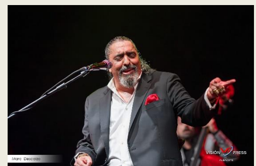
Diego el Cigala en su actuación de Albacete

Y no hay mejor manera de empezar el fin de semana con un concierto, una cena en el bar que más nos guste y después tomar un Bitter Kas.