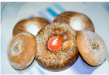
Monas de Jueves Lardero