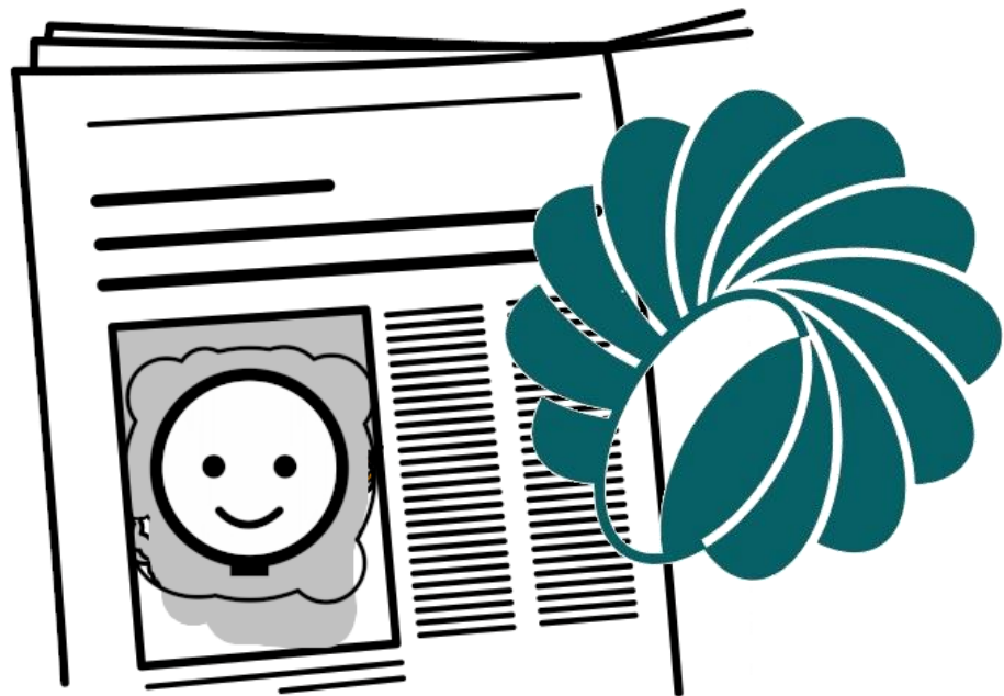
Pictograma noticias alegres