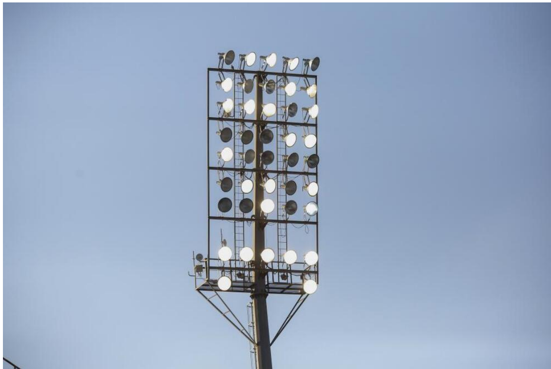
Focos estadio Carlos Belmonte.

Ahora es turno de nosotros mismos para creer en ellas, darle las oportunidades que se merecen y sentarnos a ver sus “andanzas”, seguro que ellas nos lo devolverán con resultados y trofeos. También, con todo aquello que se debería pedir a un deportista, respeto, deportividad, tolerancia e IGUALDAD.