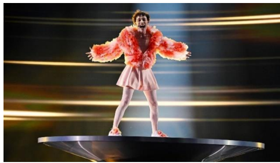
Nemo (Ganador Eurovisión 2024)

Desde un principio Suiza comenzó a destacar, siendo al final la ganadora con la canción THE CODE con el cantante Nemo, que nos habla de encontrarse así mismo para aceptar su identidad, iba vestide con chaqueta y falda rosa, se subió a una plataforma redonda que iba girando, muy original.