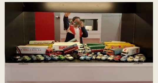
Imagen y pictograma de coche

En mi caso, desde el 2017 llevo coleccionando coches y camiones, ampliando mi colección poco a poco, tengo casi 100 piezas algunas muy valiosas. Empecé con un camión Pegaso Mofletes de Campsa. Me gusta buscar nuevos vehículos a través de ferias de antigüedades, plataformas de segunda mano, contactos, coleccionables de quioscos, es mi gran pasión. Durante estos días he podido compartir con las personas que se han acercado a ver la exposición. Mi gran pasión.