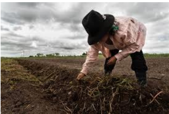
Mujer trabajando en el campo Manchego