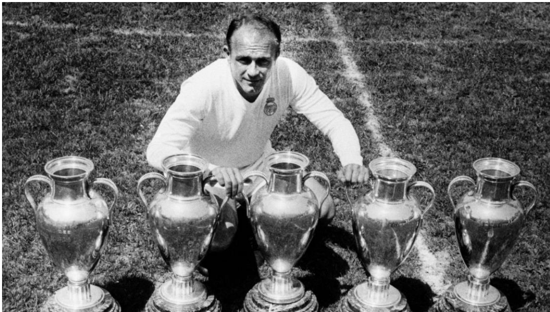
Alfredo Di Stefano mostrando sus cinco copas de Europa

Ahora toca soñar con seguir mejorando y poder ser competitivas en una categoría superior, donde les deseamos las mayores de las suertes.