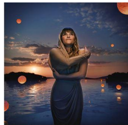
Portada disco “El Abrazo”

Su octavo disco consta de 13 canciones, en las cuales utiliza como nexo de unión la palabra Abrazo, que aparece en todas sus canciones. Destacar su gira por toda España y sobretodo apuntar como fecha indispensable su concierto en nuestra ciudad el día 31 de Agosto en la Plaza de Toros.