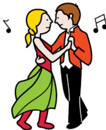
Pictograma bailar pegados