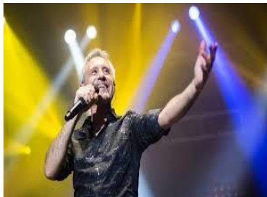
Sergio Dalma en concierto