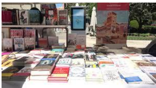
Feria del Libro (Plaza del Altozano)