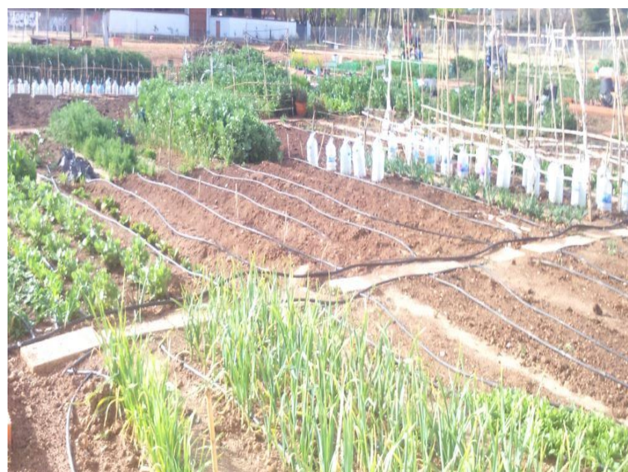
Huerto Asociación Desarrollo “Balsa los mirlos”