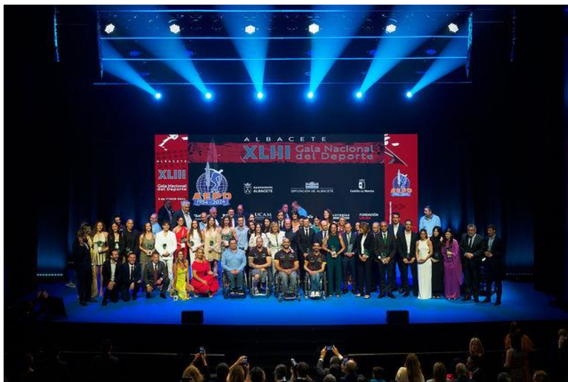
Premiados Gala del Deporte, Teatro Circo

nada menos, que una plaza para los Juegos Olímpicos de Paris, que comenzarán el día 26 de julio y no acabarán hasta el 11 de agosto. Destacar entre estos preolímpicos, el que se celebrará en Valencia donde nuestra selección de baloncesto se juega el poder asistir a tan importante cita. Mucha suerte a todos.