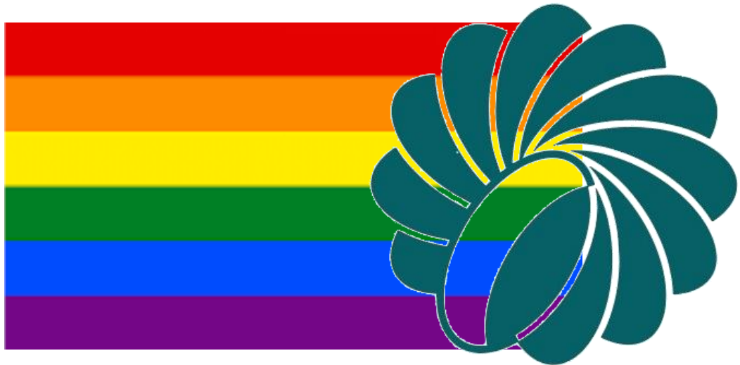
Bandera LGTBIQ+ y logo Asociación Desarrollo

También destacar el ansia viva de la gente a la hora de recoger cosas gratis, después de cinco años intentando coger un rollico de anís y un vaso de paloma, hemos desistido y hemos pensado que es mejor tomárnoslo en casa, que tampoco regalan oro, PIJO YA!!