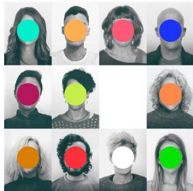
Portada disco “Figurante”

Figurante: el nuevo disco de Vetusta Morla ya está disponible en todos los formatos y en plataformas digitales, para poder ser escuchado y disfrutarlo en cualquier momento del día. Este nuevo disco consta de 11 títulos, donde destacar el tema ¡Ay Madrid!, que al día de hoy es el más escuchado en las plataformas digitales.