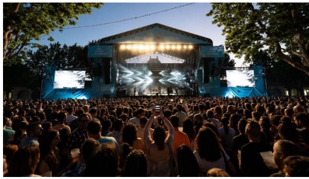
Concierto Vetusta Morla(Festival Antorchas 2024)

Recordar que ya se pueden adquirir las entradas para el “Antorchas” 2025.