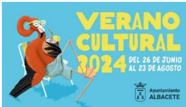
Cartel programa Verano Cultural 2024

No nos podemos olvidar del fabuloso cine de verano, ¿qué mejor que ver las películas de siempre y las más recientes en un espacio como es nuestro parque Abelardo Sánchez?, que fresquito y que a gusto se está.