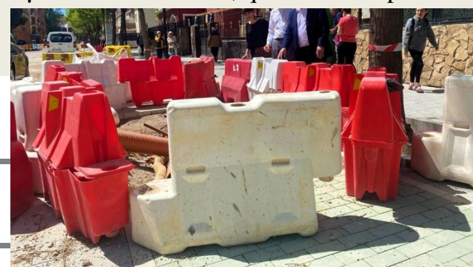
Obras C/Hermanos Jiménez