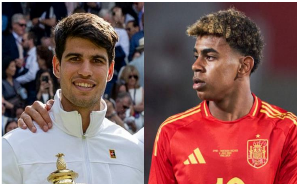
Carlos Alcaraz y Lamine Yamal.