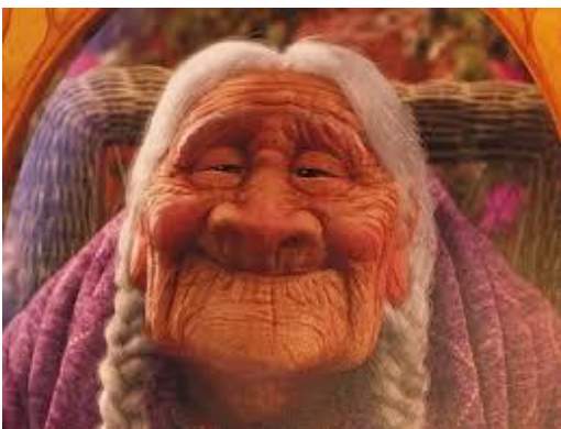
Mama Coco. Película "Coco"