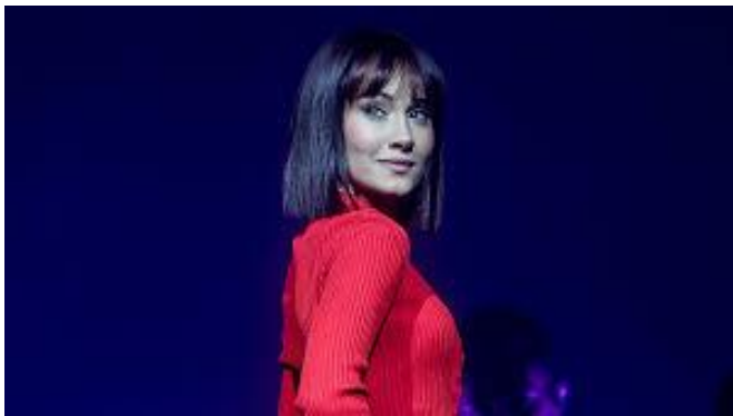
Foto Aitana con vestido rojo.

Aitana es una cantante española que comenzó su carrera en Operación Triunfo (programa de TVE), pero que pronto empezó a destacar fuera de la academia con canciones como “Lo Malo”, en colaboración con Ana Guerra y más tarde en solitario con temas como “Teléfono” o “Vas a quedarte”. Últimamente también es conocida por su romance con Sebastián Yatra, pero de eso no queremos hablar.