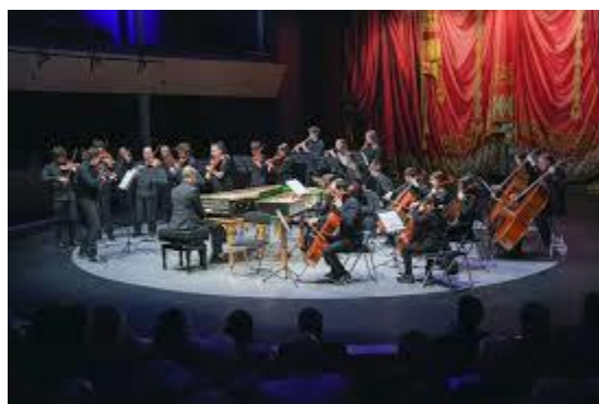
Actuación Teatro Circo Albacete