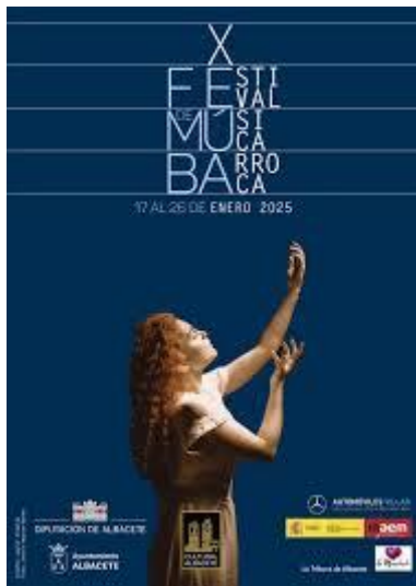
Cartel Festival Música Barroca

La música barroca o música del Barroco es el estilo musical europeo, relacionado con la época cultural homónima, que abarca aproximadamente desde el nacimiento de la ópera en torno a 1600 hasta la muerte de Johann Sebastián Bach, en 1750. Es uno de los estilos de la, generalmente llamada, música clásica o culta europea, antecedido por la música del Renacimiento y seguido por la música del Clasicismo. Caracterizada por la aparición de la tonalidad y el uso del bajo continuo, la barroca fue la época en la que se crearon formas musicales como la sonata, el concierto y la ópera.