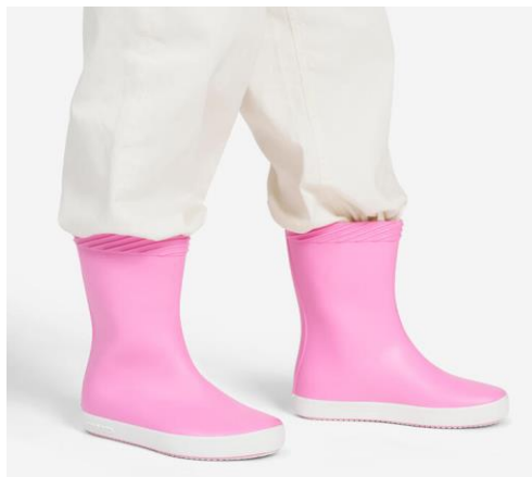
BOTAS DE AGUA DEL “DECATHLON”