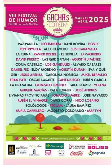
Cartel Festival GachasComedy

Y si no has podido asistir a ninguno de los espectáculos que ya se han celebrado, no pasa nada, todavía durante las primeras semanas de abril se seguirán ofreciendo grandes monólogos por toda la provincia. Aprovecha y visita algún pueblo, que no todo es ir a la calle Ancha.