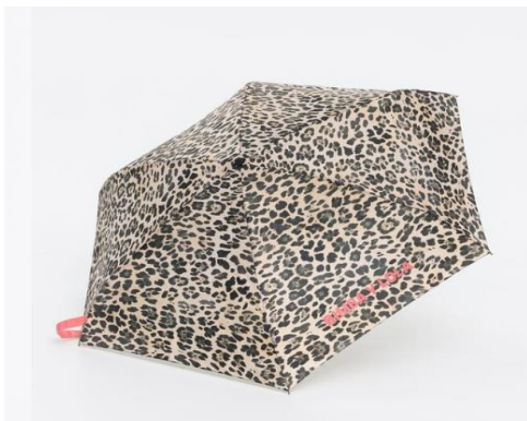
PARAGUAS DE BIMBA Y LOLA

Llevamos un mes muy lluvioso y aunque no veamos mucho el sol siempre podemos ir a la moda sin mojarnos. aquí os proponemos unas ideas: