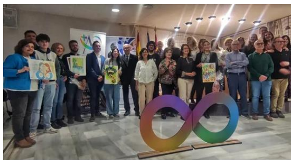
Foto de familia con ganadora, finalistas y ilustradores