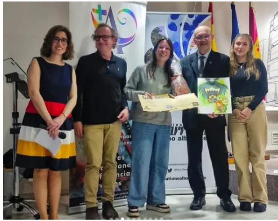
Entrega premios ganadora

Nos gustaría hacer hincapié y recordar a todos los que nos leáis, que el año próximo tendréis la oportunidad de participar en lo que será la segunda edición del concurso, y animaros a perder la vergüenza y hacernos llegar todos vuestras vivencias y sentimientos que os lleva el “mundo del TEA”.